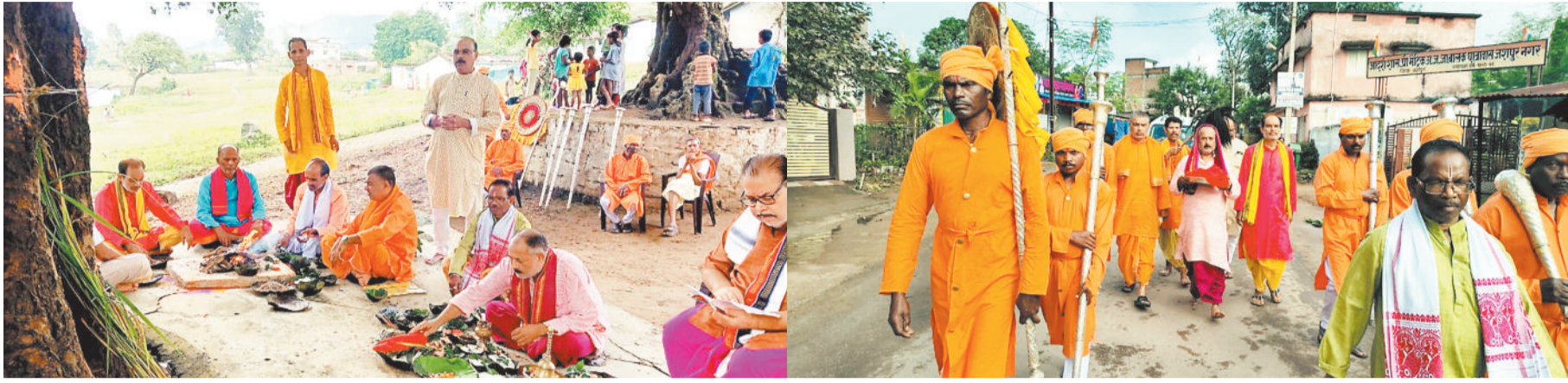
पदयात्रा कर नगर प्रवेश के बाद किया गया हवन पूजन।

सप्तमी की सुबह जब वन दुर्गा और 64 योगिनियों को नगर प्रवेश कराया गया तो पूरा शहर श्रद्धा और भक्ति में डूब गया। नगाड़ों की थाप, पारंपरिक रियासती वेशभूषा, नंगे पैर चल रहे बैगा और राजपुरोहितों का दल तथा हजारों श्रद्धालुओं की भीड़ - यह दृश्य जशपुर की शेष पंज 4 पर