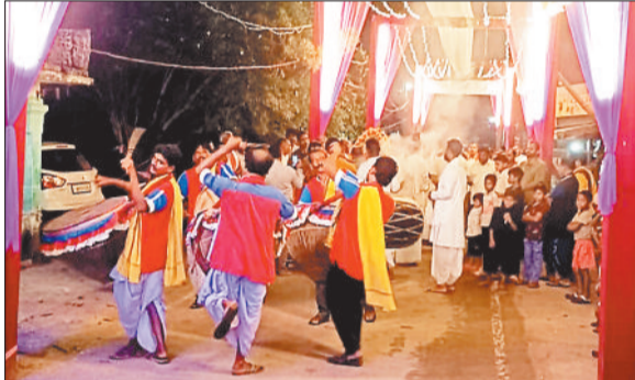
डोला में शामिल गांव के लोग।

जनसेवा अमेद आश्रम नारायणपुर - चितकवाइन में आज आस्था का अद्भूत सैलाब खड़ा। अक्सर था मां भगवती का डोला निकलने का। इसमें शामिल होने दूर दूर से श्रद्धालु नारायणपुर