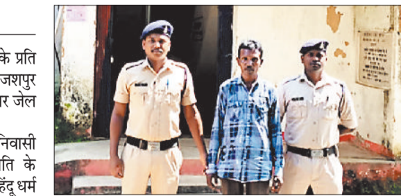
पुलिस गिरफ्तार में आरोपी।

बगीचा क्षेत्र में हिंदू धर्म और देवी दुर्गा के प्रति अभद्र टिप्पणी करने वाले आरोपी को जशपुर पुलिस ने गिरफ्तार कर न्यायिक रिमांड पर जेल भेज दिया।