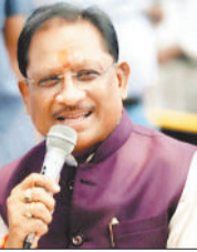
मुख्यमंत्री साय ने दी सौगात, 1 करोड़ 65 लाख की लागत से बनेगा विश्राम गृह

गौरतलब है कि जिले के फरसाबहार में भी विश्राम गृह निर्माण के लिए 1 करोड़ 72 लाख रूपए मंजूरी मिल चुकी है। बागबहार क्षेत्र के लोगों के लिए लंबे समय से विश्राम गृह की